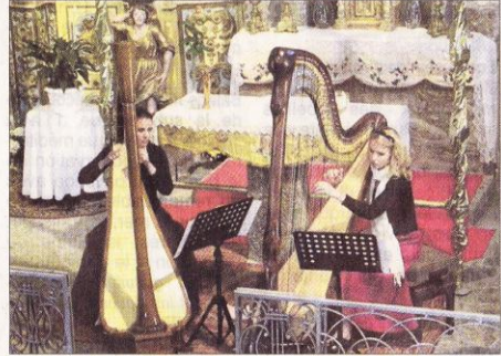
► Cinq concerts sont programmés cet été à la chapelle.

des P.-O. sur la « notion de patrimoine en France ».